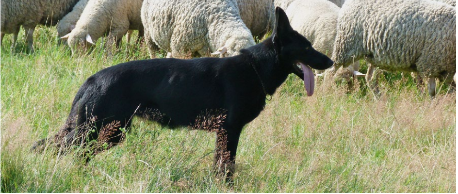
Abb. 6: Selbständig auf die Herde zugehen und eventuell strafen