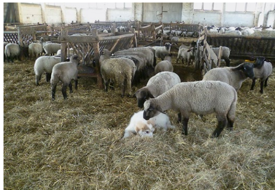
Abb. 18: Zwischen Hund und Schafen entwickeln sich »Freundschaften«.