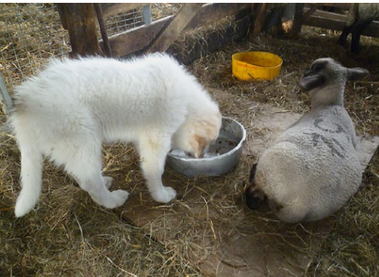
Abb. 19: Welpen und Schafe nutzen die gleiche Tränke.