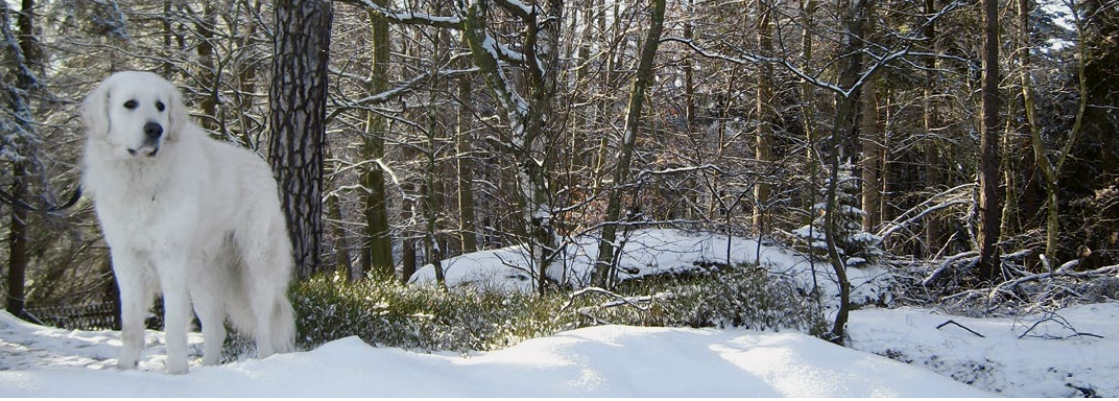
Abb. 33: Ungarischer Kuvasz (SCHNEIDER, 2013)

Läufe sowie an der Rute, Farbe rehbraun, rot, schwarz-weiß, rotgestromt oder schwarzgestromt, Ohren klein und hängend