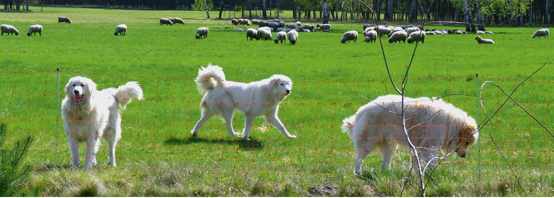
Abb. 23: Ältere Herdenschutzhunde markieren das Territorium um die Schafe und beschützen die Herde wirkungsvoll.

vom Schäfer gestreichelt werden. Der Schäfer ist dann der Tröster.