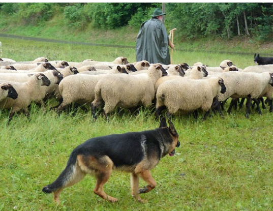
Abb. 1: Der Herdengebrauchshund, Hütehund, arbeitet mit dem Schäfer zusammen.