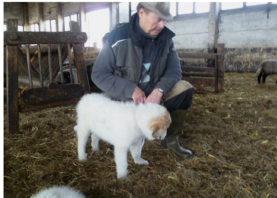
Abb. 20: Auch ein Schutzhund braucht eine gute Leinenföhrigkeit