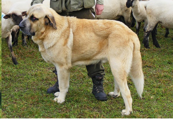
Abb. 32: Mastin Español (HENNIG, 2013)