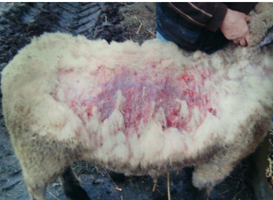
Abb. 28: Erwachsene Hunde, die immer wieder Schafe beißen, sind nicht mehr als Schutzhunde einzusetzen.