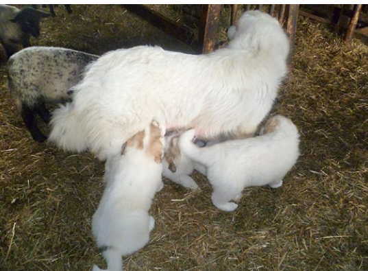
Abb. 14: Welpen werden in der Herde geboren und gesäugt.

Mit Beginn der Erwachsenenphase (etwa ab dem 12. Monat) zeigt der Herdenschutzhund ein fürsorgliches Schutzverhalten. Die Herde wird als »Familie« angesehen. Auf jedes Ereignis, das nicht in die »normale« Erfahrungswelt des Hundes passt, wird vor allem mit Bellen reagiert. Ab einem Alter von 1,5 bis 2 Jahren (je nach Rasse) wird das Territorium um die Schafe markiert und wirkungsvoll beschützt.