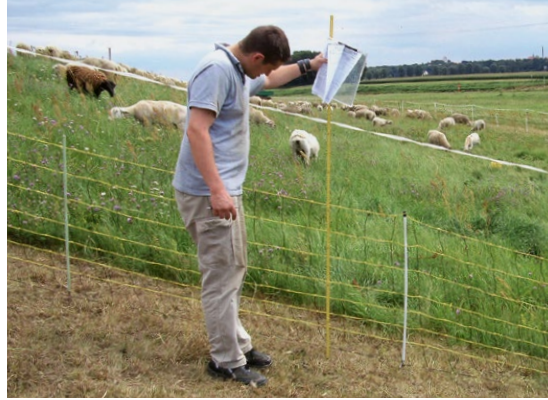
Abb. 42: Zäune müssen grundsätzlich immer bündig am Boden abschließen.