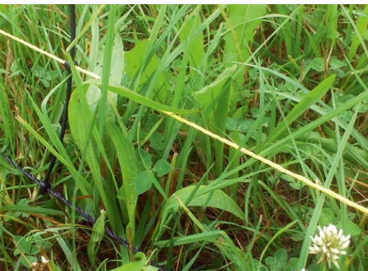
Abb. 40: Starker Bewuchs führt zu Leistungsverlust.

Wie bereits beschrieben, kann Leistungsverlust auch durch Bodenbewuchs entstehen. Berührt dieser das Netz oder die Litze, entsteht ein »Kurzschluss«. Die Spannung fällt ab, der Strom gelangt über die Pflanze in den Boden. Ein optimal gepflegtes Zaunsystem ist frei von Bewuchs und besitzt einen geringen Gesamtwiderstand.