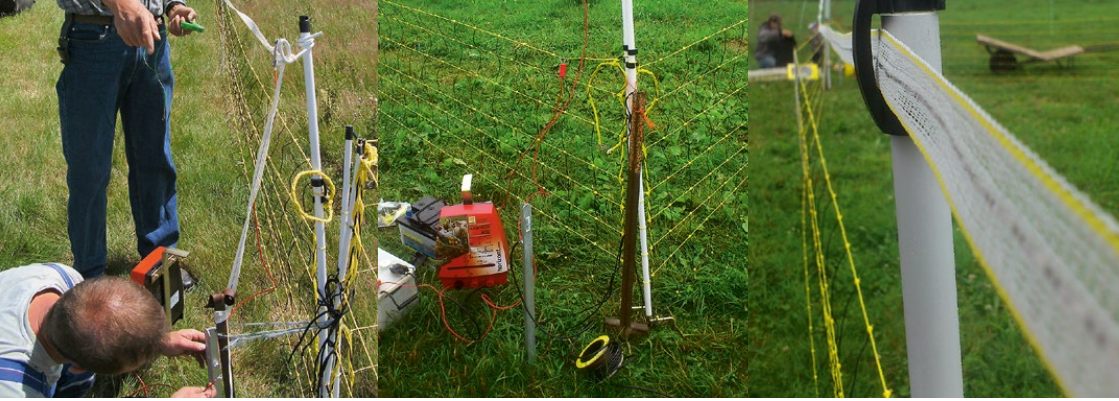
Abb. 44: Ausrichtung der Ecken