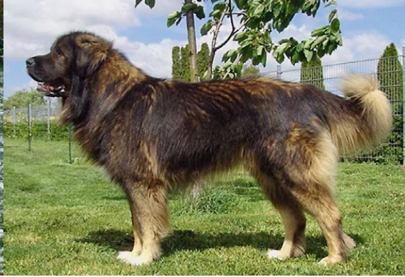
Abb. 35: Kaukasischer Owtscharka (SCHLEGEL-BIRKE, 2013)