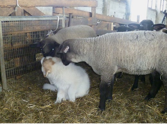
Abb. 15: Schafe und Welpen suchen den Kontakt.