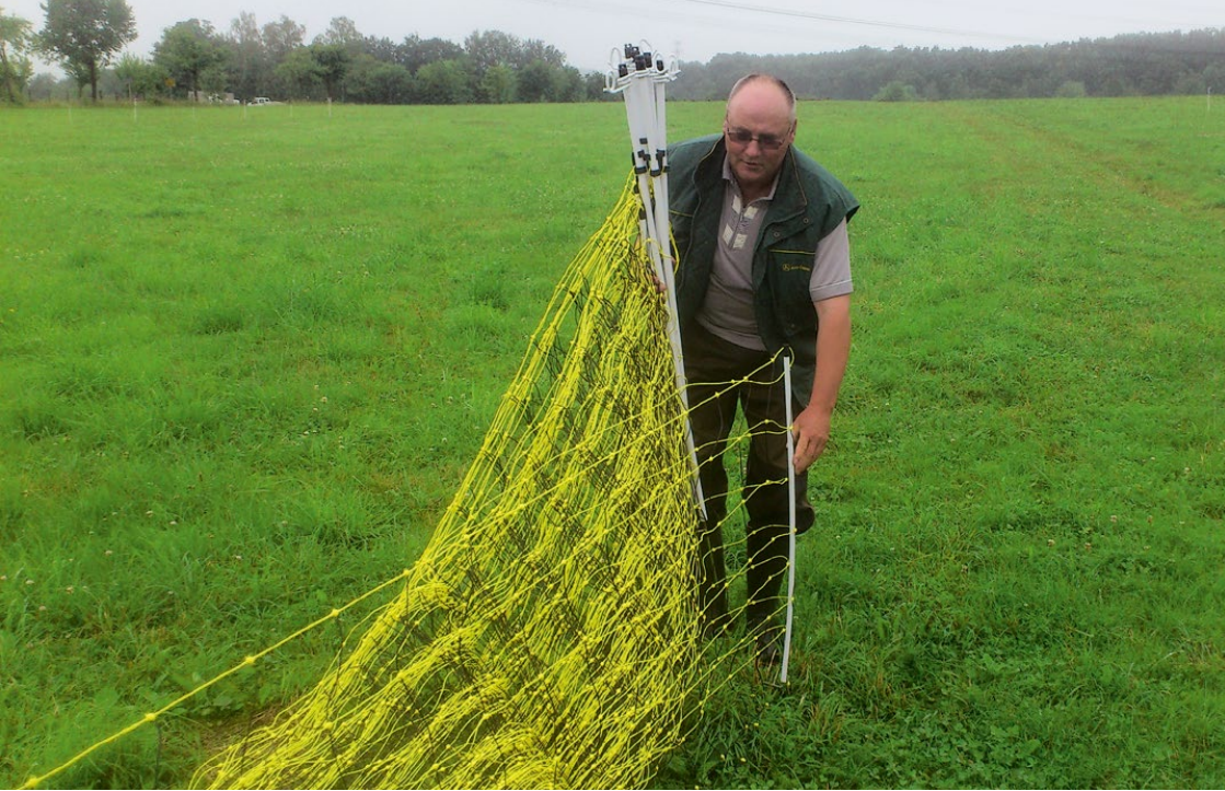
Abb. 36: Auslegen der Elektronetze zur Abwehr des Wolfes

stabil und langlebig, bezahlbar und für den Anwender leicht handhabbar sein. Außerdem muss er flexibel einsetzbar sein.