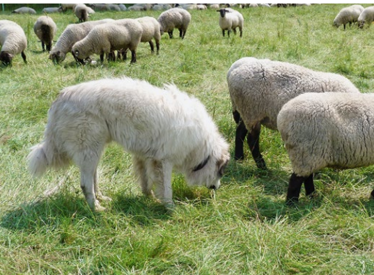
Abb. 9: Neugieriges, prüfendes Beschnuppern

unterwürfiges Verhalten zeigen. Die Unterwürfigkeit zeigt sich dabei durch die Vermeidung von Blickkontakt und das Anlegen der Ohren, wenn sie sich den Herdentieren nähern. Das Hinlegen vor ihnen auf den Rücken ist ebenfalls ein Zeichen dafür. Neugieriges, prüfendes Verhalten drückt sich weiterhin darin aus, dass der Hund das Herdentier eingehend beschnuppert. Beide Verhaltensweisen sind für einen Herdenschutzhund gut geeignete Veranlagungen (Abbildung 9).