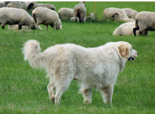
Abb. 11: Das Zurückweichen in die Herde kennzeichnet einen aufmerksamen Herdenschutzhund.

der »Routine« zu reagieren. Folgerichtig wurde und wird bei der Selektion von Herdenschutzhunden darauf hingearbeitet, dass sie jede neue oder verdächtige Situation im Umfeld durch Alarmbellen anzeigen. Dabei ist es besonders wichtig, dass diese schützende, sichernde Verhaltensweise dem unmittelbaren Schutz und der Verteidigung der Herde dient. Sie sollte nicht primär auf eine offene Aggression gegenüber dem Störfaktor ausgerichtet sein.