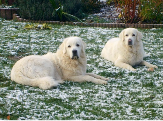
Abb. 34: Polnischer Owczarek Podhalanski (PFEIFER, 2013)