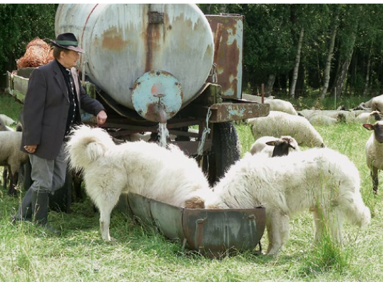
Abb. 24: Wie als Welpen gelernt, wird die Tränke mit den Schafen gemeinsam genutzt.