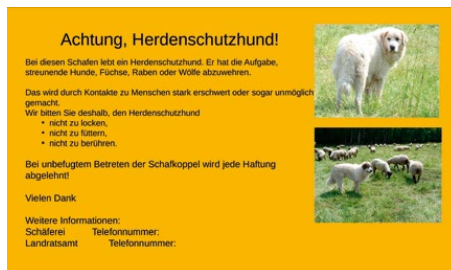
Abb. 27: Die Weide mit Herdenschutzhunden muss gut gekennzeichnet sein.