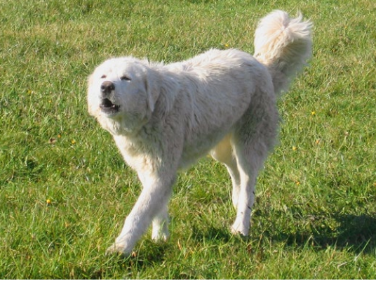
Abb. 31: Pyrenäenberghund