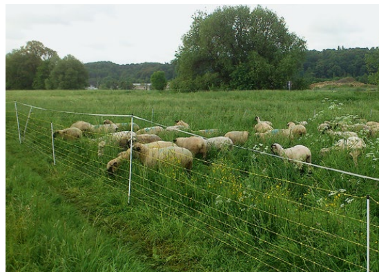
Abb. 41: Elektronetz mit Zaunband, sogenanntem »Flutterband«