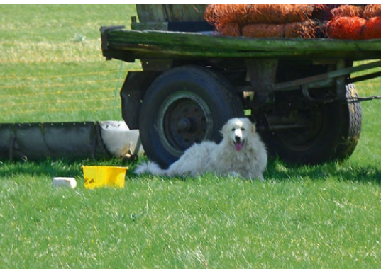
Abb. 21: Wasserwagen als Schattenspender

Ebenso ist der Rückzug auf einen Beobachtungsposten abseits oder auf etwas höher gelegene Plätze außerhalb der Herde, aber innerhalb der Koppel, zur besseren Beobachtung der Herde positiv zu beurteilen. Herdenschutzhunde meiden in der Regel eine Hundehütte. Sie suchen ständig den Kontakt zur Herde, nutzen mit ihnen gemeinsam Schattenplätze und legen sich gegebenenfalls unter den Wasserwagen (Abbildung 21).