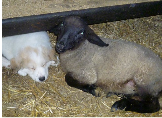
Abb. 16: Zwischen Hund und Lämmern entstehen sichtbare Beziehungen.