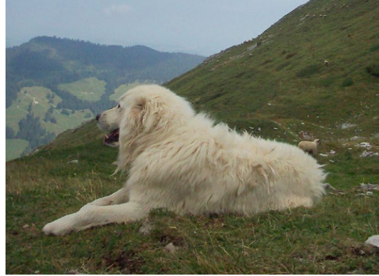
Abb. 30: Maremmano

Es gibt eine Vielzahl an Rassen, Typen und Schlägen, die als Herdenschutz Hunde eingesetzt werden. Zu den in Deutschland bekanntesten und von der Fédération Cynologique Internationale (FCI) anerkannten Herdenschutzhundrassen gehören der aus Italien stammende Cane Pastore Maremmano-Abrucese ( Marremmano ) und der aus Frankreich kommende Chien de Montagne des Pyrénées oder Patou des Pyrénées ( Pyrenäenberghund ), dessen spanisches Gegenstück der Mastin Español ist. Aus Ungarn kommt der Kuvasz . Der Owczarek Podhalanski ( Polnischer Hirtenhund ) wird vorwiegend in Polen eingesetzt. Aus der Türkei sind die Rassen Akbas , Karabas und Kangal bekannt. Aus dem Kaukasus und den angrenzenden Gebieten stammt der Kaukasische Owtscharka .