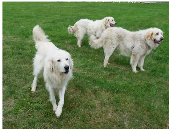
Abb. 5: Herdenschutzhunde imponieren durch Bellen und Aufstellen dem Gegner und verteidigen ihre Herde.