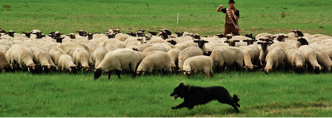
Abb. 2: Hütehund im Einsatz