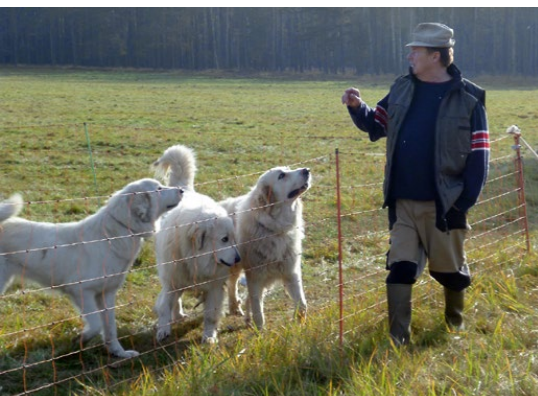
Abb. 26: Die Bezugsperson wird begrüßt.

geres Beobachten, sollten die Junghunde zeitweise von den Lämmern ferngehalten werden. Mutterschafe oder auch Ziegen helfen, sie zu disziplinieren. Zuweilen werden Welpen von den Mutterschafen mit Kopfstößen traktiert. Auf diese Weise lernt der Junghund, die Schafe zu respektieren und seinen Platz in der Herde zu finden.