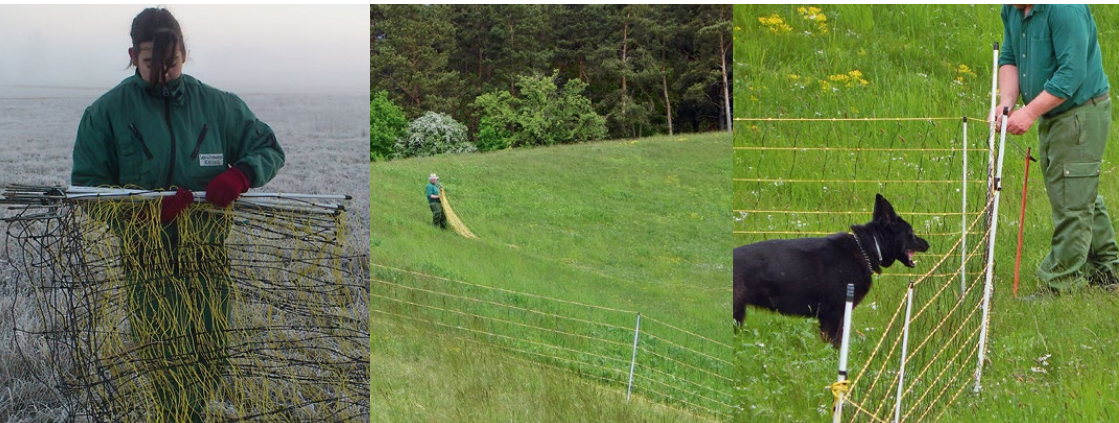
Abb. 37: Arbeitsablauf beim Aufbau der Koppel

Mit dem Auslegen der Netze wird gleichzeitig der Verlauf des Zaunes festgelegt und die Grenze gezogen. Zu beachten ist, dass Unebenheiten ausgeglichen und angrenzende Gewässer, wie Gräben oder kleine Bäche, ausgegrenzt oder einbezogen werden müssen.