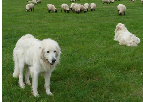
Abb. 12: Hohe Verteidigungs-, aber keine Angriffsbereitschaft