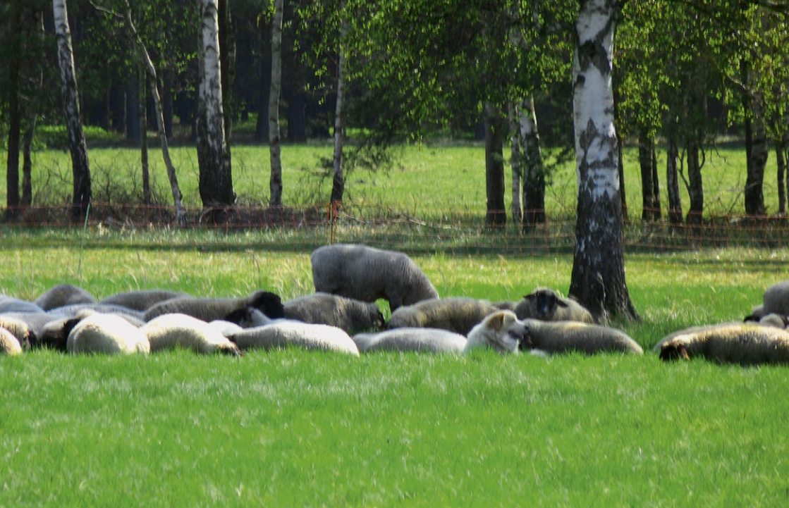
Abb. 22: Ruhephase in der Mittagszeit unter den Bäumen mit der Herde

Ein trübes, langsames Reagieren während der Mittagshitze ist normal (Abbildung 22). Mit Anbruch des Abends bzw. während der Nacht erhöht sich die Wachsamkeit wieder deutlich. Das Tag- und Nachtverhalten der Angreifer ist ähnlich.