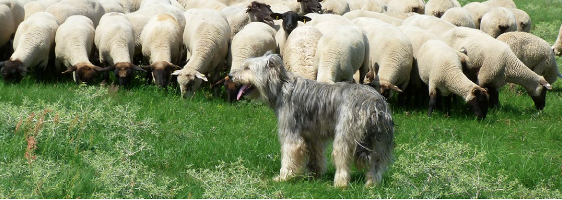
Abb. 3: Altdeutscher Hütehund – Schafpudel

Die Arbeit mit Hütehunden hat sich bis heute in sächsischen Schäfereien erhalten. Durch die Veränderung der Weidetechnik hat sie jedoch an Bedeutung verloren. Die Ausbildung von Hunden bis zu selbständigen Hütehunden ist sehr vielschichtig. Geduld und Sachkenntnis des Schäfers, der in der Regel auch der Ausbilder des Hundes ist, ist notwendig. Zudem verlangen die Hunde eine regelmäßige sowie sinnvolle Beschäftigung und klare Zuständigkeitsver-