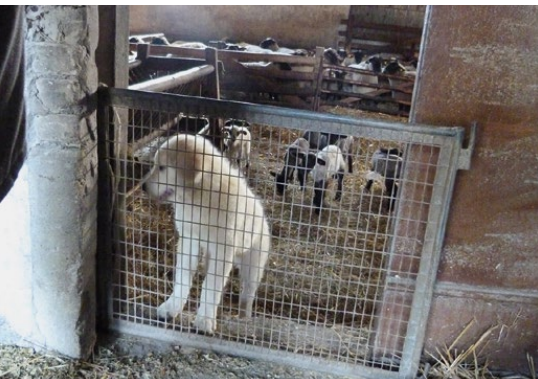
Abb. 17: Die Türschwelle ist die Grenze.