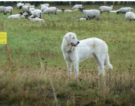
Abb. 4: Der Herdenschutzhund arbeitet ohne Aufsicht.

Erfolgreich ist die Zusammenarbeit von Schäfer und Hütehunden, wenn Harmonie und Disziplin erreicht sind. Der Hütehund ist dann auf den Schäfer fixiert!