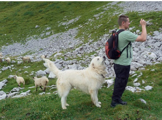
Abb. 13: Fremden Personen gegenüber zeigt er ein neutrales Verhalten.

Die Sozialisierung des Herdenschutzhundes mit Fremden ist minimal. In Sachsen ist die Koppelschafhaltung vorherrschend. Gegenüber fremden Personen außerhalb der Bezäunung soll er ein neutrales Verhalten (keine Furcht, keine Aggression) zeigen. Bei potentiellen Gefahren, z. B. einen Spaziergänger mit Hund, begleitet er entlang des Zaunes.