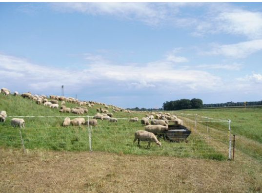
Abb. 43: Ordnungsgemäßer Zaunbau als Voraussetzung für den Herdenschutz