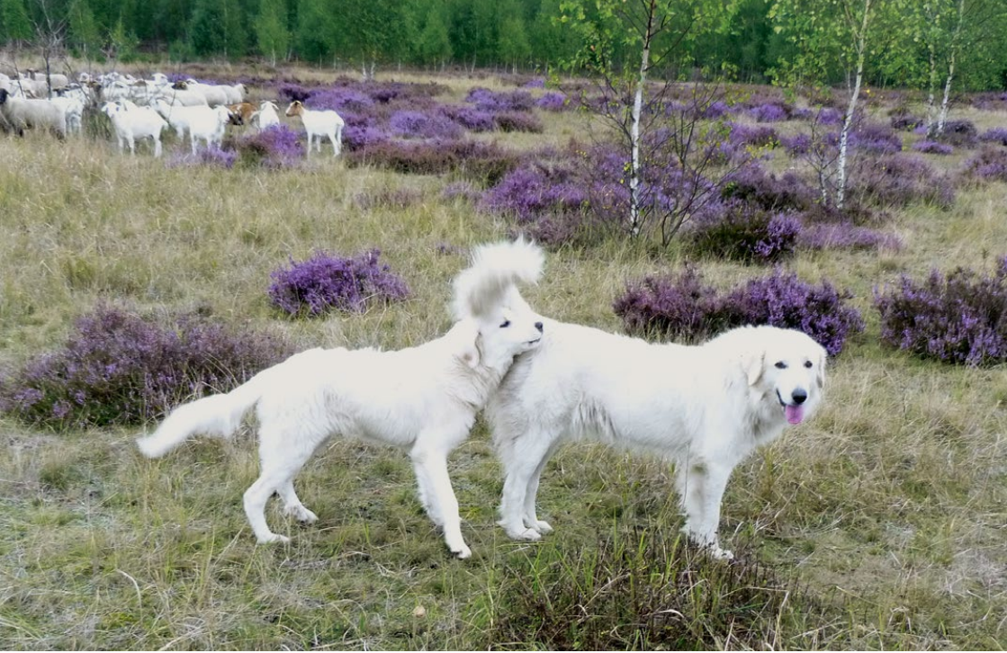
Abb. 29: Der Junghund orientiert sich am Althund und sucht Kontakt.

Welpen, die bereits in den ersten Wochen ihrer Sozialisierung Ansätze zur Aggressivität zeigen (Sträuben der Haare bei Annäherung der Schafe oder der Bezugspersonen) oder Scheu nicht ablegen, sind für die Ausbildung zum Herdenschutzhund nicht geeignet. Sie können zur Gebäudebewachung oder auch als Familienhunde abgegeben werden. Dem neuen Besitzer muss durch aufklärende Gespräche das Verhalten des Hundes deutlich gemacht werden.