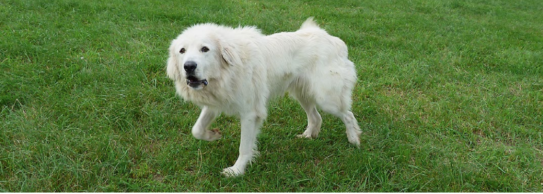
Abb. 10: Jede neue oder verdächtige Situation im Umfeld wird durch Alarmbellen angezeigt.

tieren werden so geschult und ausgebildet. Das Zurückweichen in die Herde bei der Annäherung von etwas »Fremdem« ist ebenfalls ein Merkmal für einen aufmerksamen Herdenschutzhund. So müssen bereits die Welpen an »ihre« Herde gewöhnt werden, um Wachsamkeit und soziale Bindung aufzubauen.