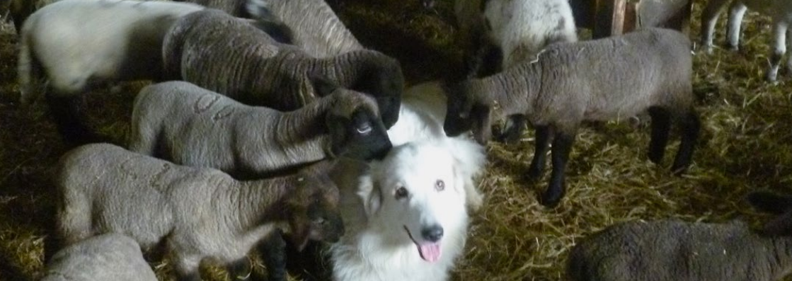
Abb. 25: Das Verhalten des Junghundes muss konsequent beobachtet werden, um Fehler zu korrigieren.