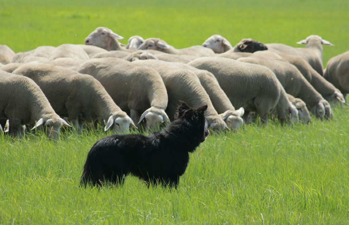
Abb. 7: Hütehunde müssen fixieren und eventuell strafen.

auch verschiedene Reizschwellen. Zum Beispiel kann er eine niedrige Reizschwelle gegenüber fremden Hunden, aber eine hohe gegenüber Geräuschen haben. Ob ein Hund auf einen Reiz reagiert oder nicht, hängt von der Stärke des wahrgenommenen Reizes und von der Bereitschaft des Tieres, auf diesen Reiz zu reagieren, ab.