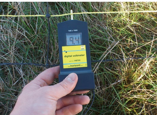
Abb. 38: Messung der Spannung

Aus Sicherheitsgründen für Mensch und Tier sollte grundsätzlich nur so viel Impulsenergie eingesetzt werden wie benötigt wird. Im Idealzustand fließt bei einem guten, nicht durch Pflanzenwuchs beeinflussten Zaun ein sehr geringer Strom bei hoher Spannung. Berührt ein Tier den Zaun, be-