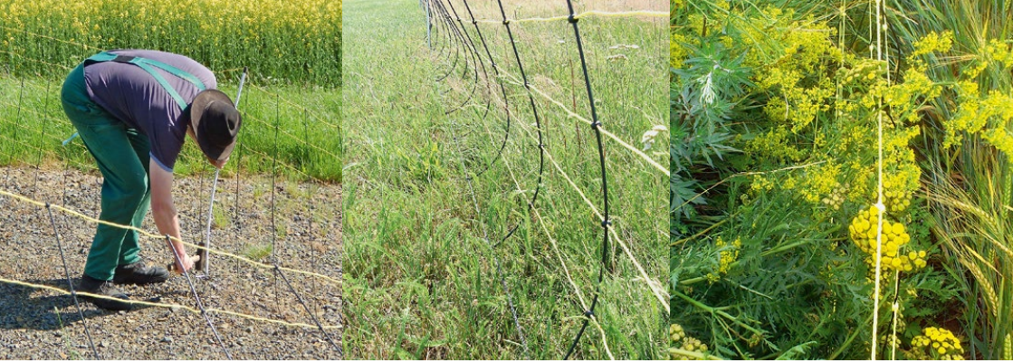
Abb. 39: Unterschiede im Pflanzenbewuchs: Ohne Bewuchs – kein Kontakt zum Netz, leichter Bewuchs – teilweise und selten Berührungen, normaler Bewuchs – fortlaufender Kontakt zwischen Pflanzen und Netz

kommt es einen leichten Schlag. Der Strom fließt über das Tier in den Boden ab. Von dort gelangt der Strom über die Erdungsstäbe zurück in das Weidezaungerät. Ein optimales Zaunsystem hat einen geringen Gesamtwiderstand. Dieser wird in Ohm angegeben. Dies betrifft alle stromdurchflossenen Bestandteile wie Zaunmaterial, Erdboden, Erdungspfähle und Verbindungsstellen. Je höher der Gesamtwiderstand des